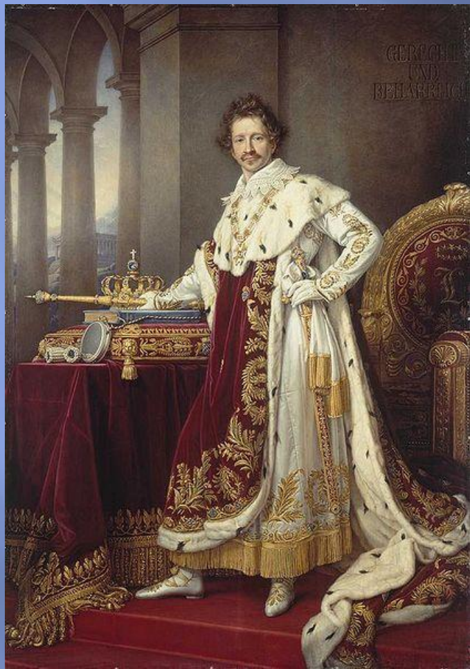
King Ludwig I and Princess Therese

First Oktoberfest took place 5 days after their wedding on October 12, 1810.