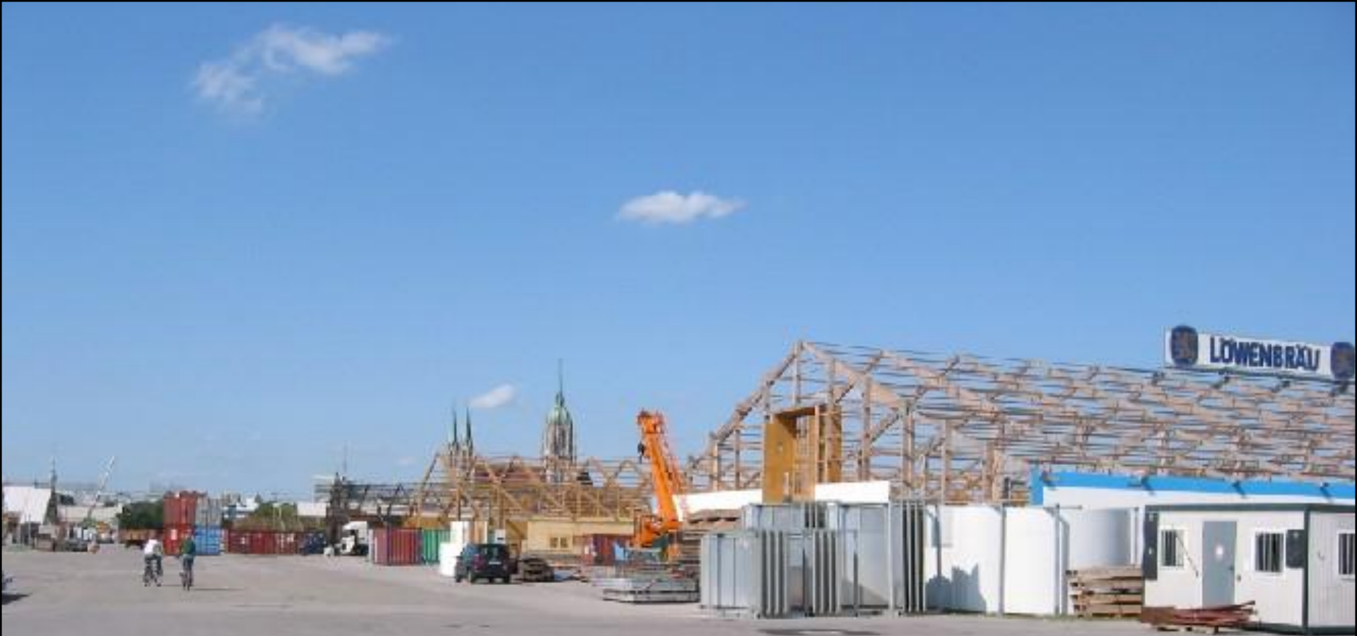
Building of the beer tents begins as early as June and July.